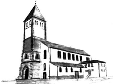
St. Mariä Himmelfahrt