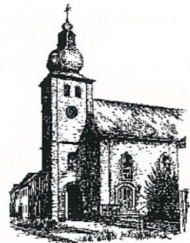
St. Philippus und Jakobus